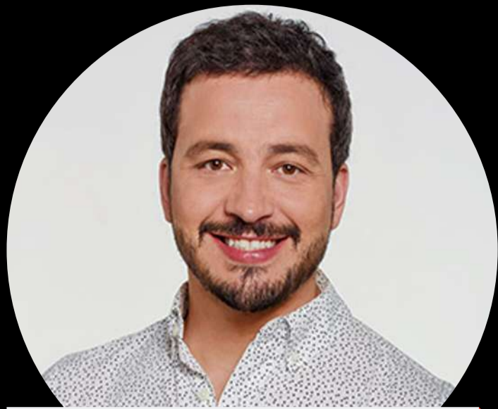
RAFAEL CORTEZ APRESENTADOR E JORNALISTA